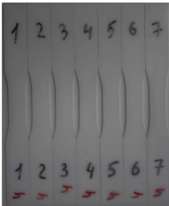
Фотографии элементарных образцов REC HIPS до испытаний