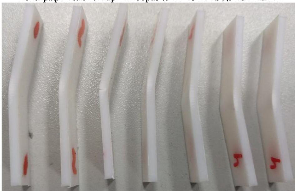
Фотографии элементарных образцов REC HIPS после испытаний