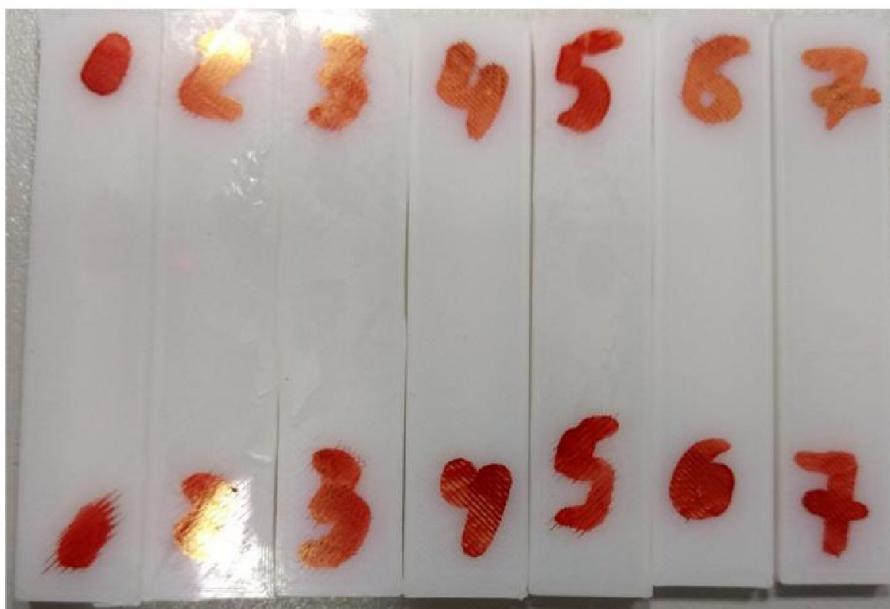
Фотографии элементарных образцов REC HIPS до испытаний