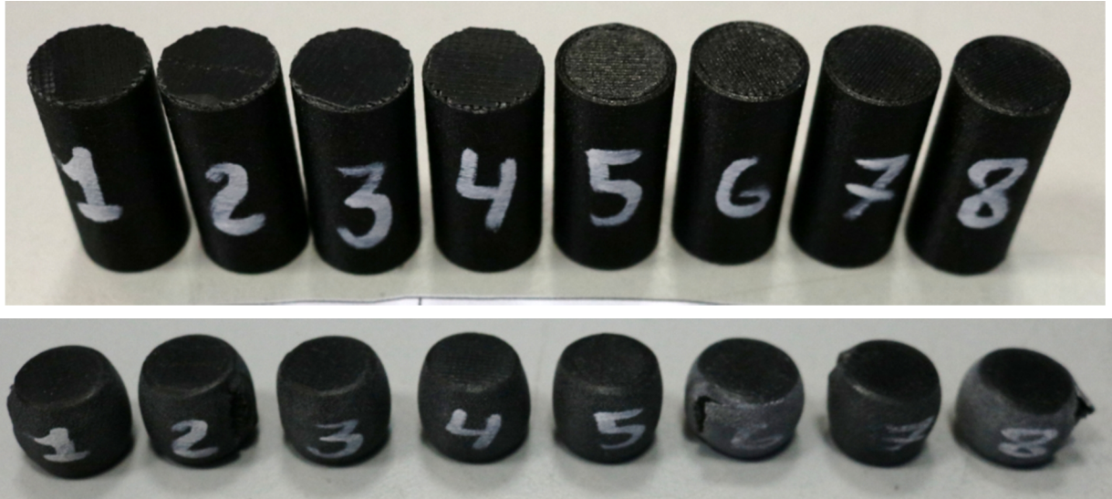
Фотографии элементарных образцов 1÷7 до и после испытаний