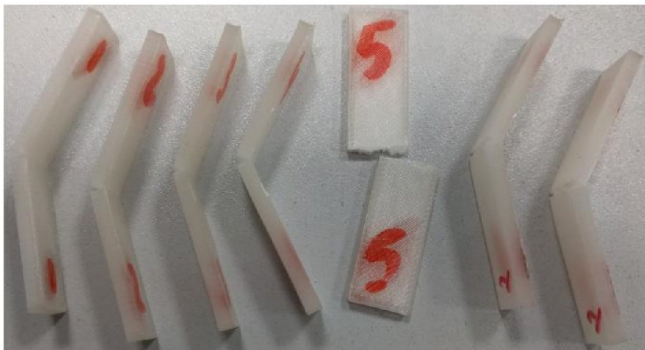
Фотографии элементарных образцов REC PLA после испытаний